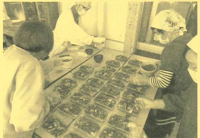
【レストランコーナー (やきそば)】