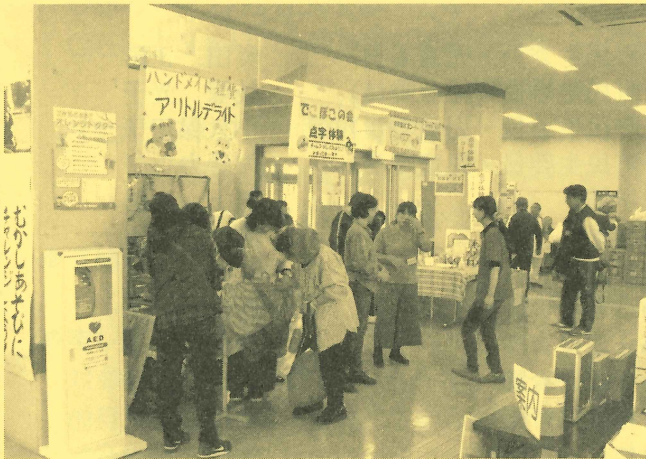
【雑貨販売・点字体験・非常食試食】