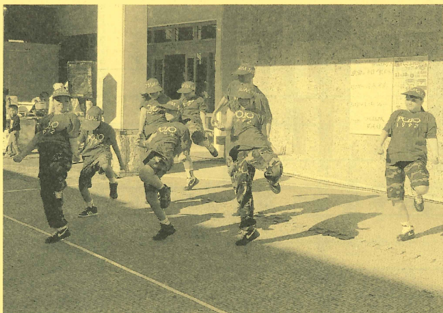
【ミドルステップス ダンスステージ】