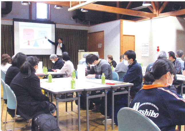
19 災害ボランティア研修会の開催 【災害ボランティアとは？】