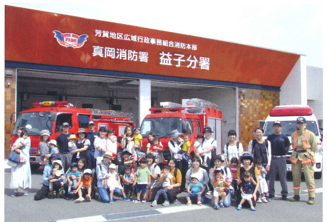
5・6 雀の学校・モンチッチ 【消防署見学】