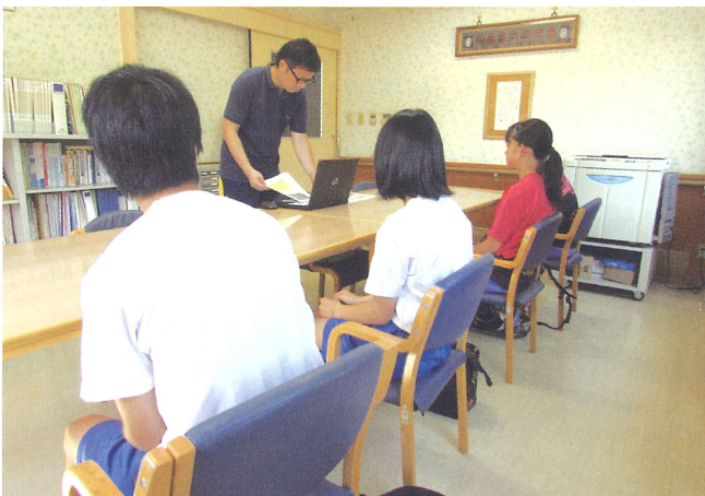
17 ボランティアスクール開催 【光輝舎】